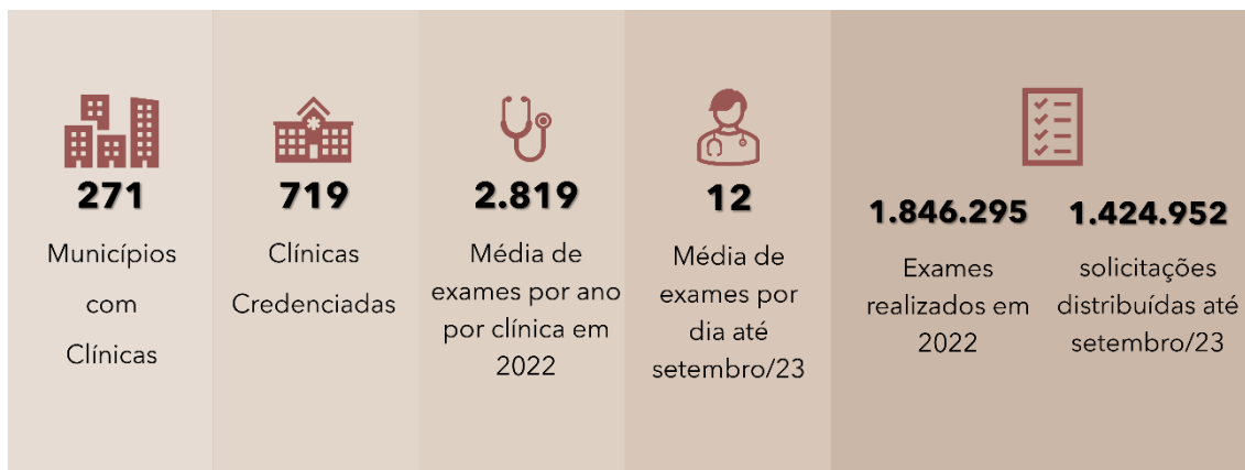
Figura 2 - Dados de atendimento de 2022

Ainda, é relevante observar que a distribuição de clínicas não é parametrizada, o que leva a grandes diferenças de demanda. A Tabela 3 - Municípios, quantidade de clínicas e habitantes por clínica demonstra a quantidade de municípios em cada quantitativo de clínicas e por consequência a média de habitantes por clínica em cada conjunto. Por exemplo, temos um único município que conta com 14 clínicas, gerando uma média de 16.267 habitantes por clínica, o que propicia cerca de 2.500 atendimentos por ano. No caso dos municípios com sete clínicas, temos novamente uma média abaixo de 20 mil habitantes e 2.500 atendimentos, porém se abrimos os dados desses três municípios a população real vai de 87 mil a 227 mil, ou seja, nesse município com menor quantidade de população, com cerca de 87 mil habitantes, a média ano de atendimentos não chega a 1,6 mil, como se observa na Tabela 4 - detalhamento municípios com 7 clínicas.