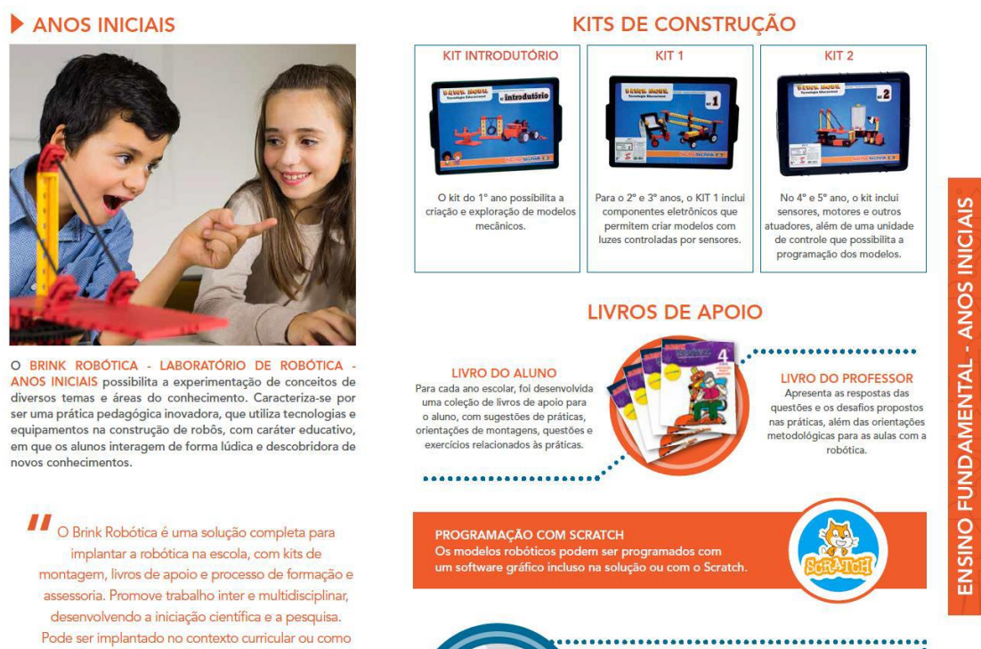
(Figura- Catálogo Brink Mobil)